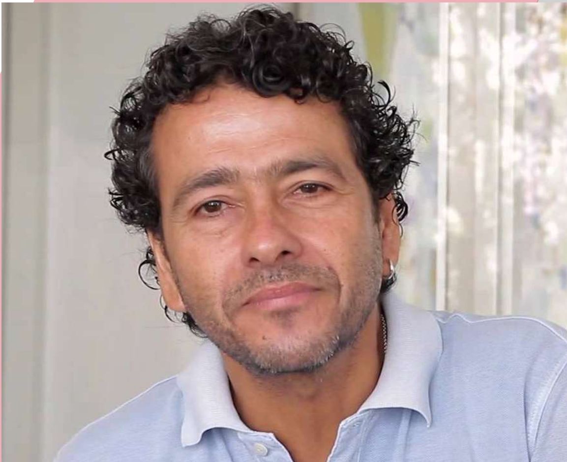
AMADEU (Marcos Palmeira)