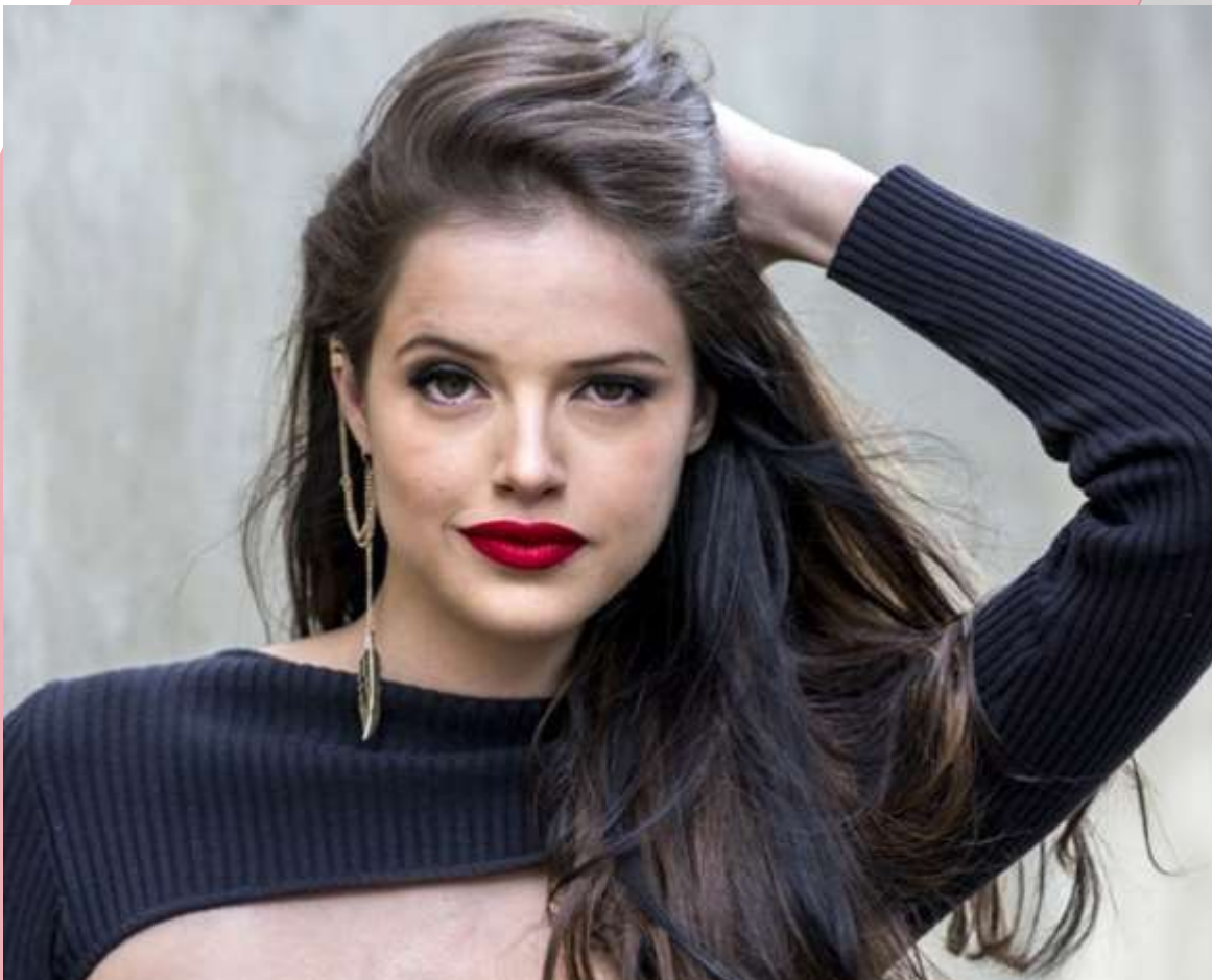
JOSIANE (Agatha Moreira)

É a grande vilã da novela. Arma para a mãe se casar com Régis, pois deseja a ascensão social que ele representa. Tem horror do pai, Amadeu, quando o conhece. Resolveu tornar-se digital influencer . Faz tudo para conquistar seguidores. Ser convidada para o fashion week seria sua vitória. Usa roupa hiper fashion e cabelos idem.