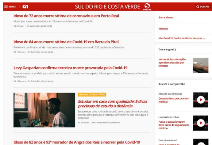
Feed da Capa

A chamada fica localizada nos feed de notícias dos portais, tanto na capa quanto nas matérias conforme exemplos abaixo: