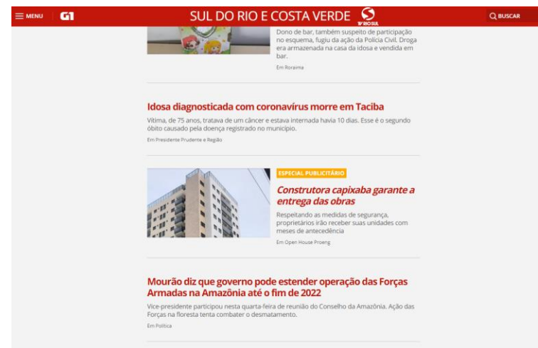
Feed das Matérias