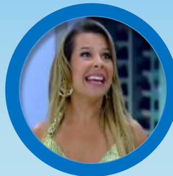
ISADORA Fernanda Souza